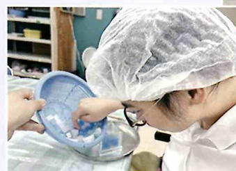
福祉事業所での実習

本校では将来の自立に向けた準備として、キャリア教育を全学年で展開しています。特に、高等部においては、一般就労・福祉就労・進学など、それぞれの社会参加を目指して日々学習に取り組んでいます。