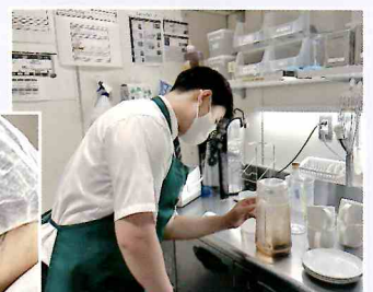
一般企業での実習