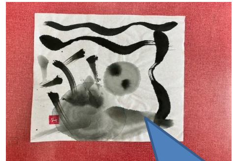
筆の扱いの練習。 実際に目の前でやって見せ、