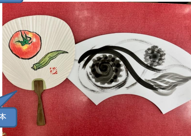
夏野菜が描ける人の見本