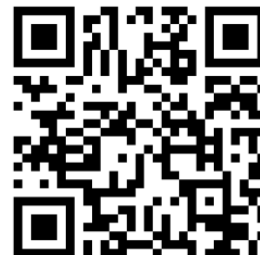
参加申し込み用二次元コード

〈電話〉042-792-4260 〒195-0075 町田市山崎一丁目2番17号