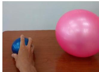
引いたボールと基準のボールをそろえて大きさを比べる。