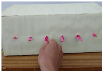
『紐くじ引き』 色々な長さの紐が入っている。