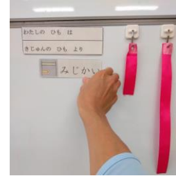
長いか短いかを判断して、「ながい」「みじかい」を貼る。