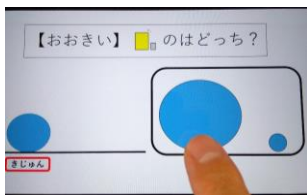
『パワーポイント問題』 GIGA端末を使用し、各自で問題に取り組む。選択肢をタップすると基準の隣に出るようにしている。