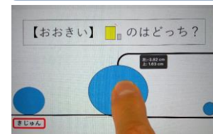
慣れてきたら、自分ドラックして比べる。