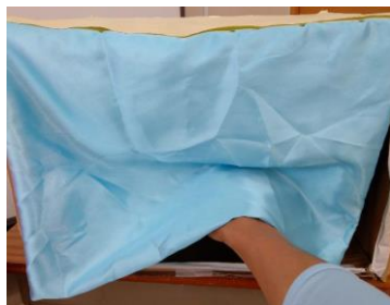
『ボールくじ引き』 色々な大きさのボールが入っている。