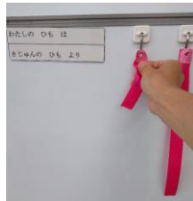
引いた紐と基準の紐をそろえて長さを比べる。